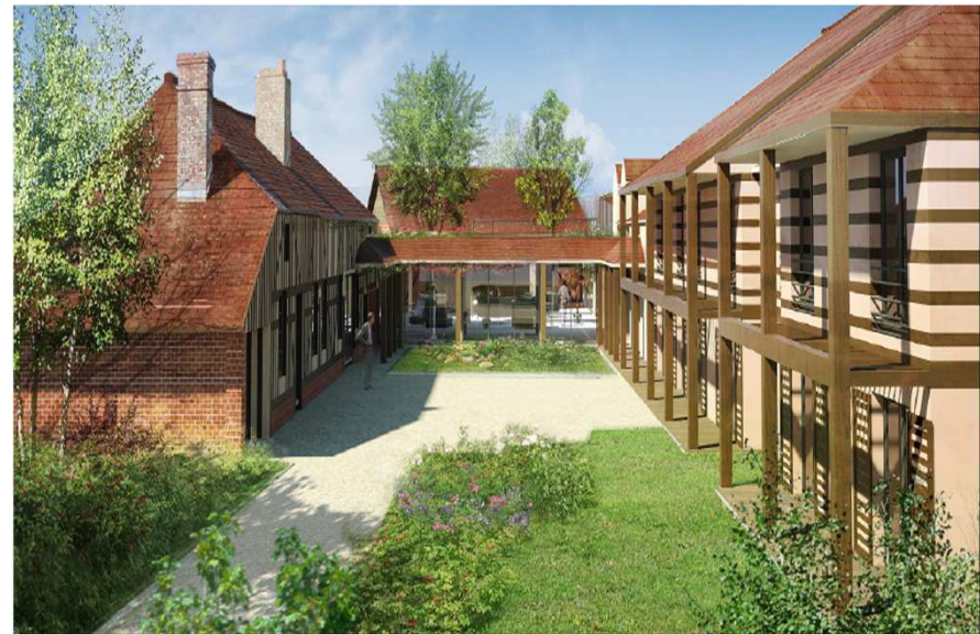
Construction neuve et réhabilitation